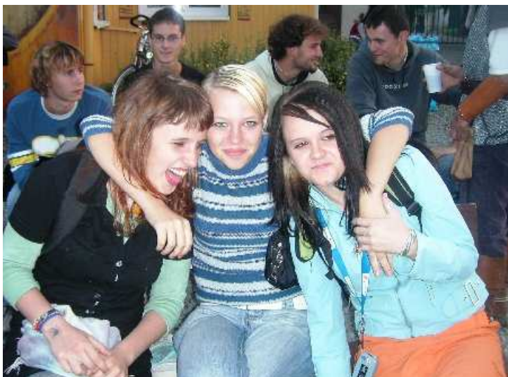
z oslavy druhých narozenin klubu...

V roce 2005 byl klub finančně podpořen Ministerstvem práce a sociálních věcí, Jihomoravským krajem (sociální odbor) a Městem Kyjov. Za poskytnuté příspěvky děkujeme.